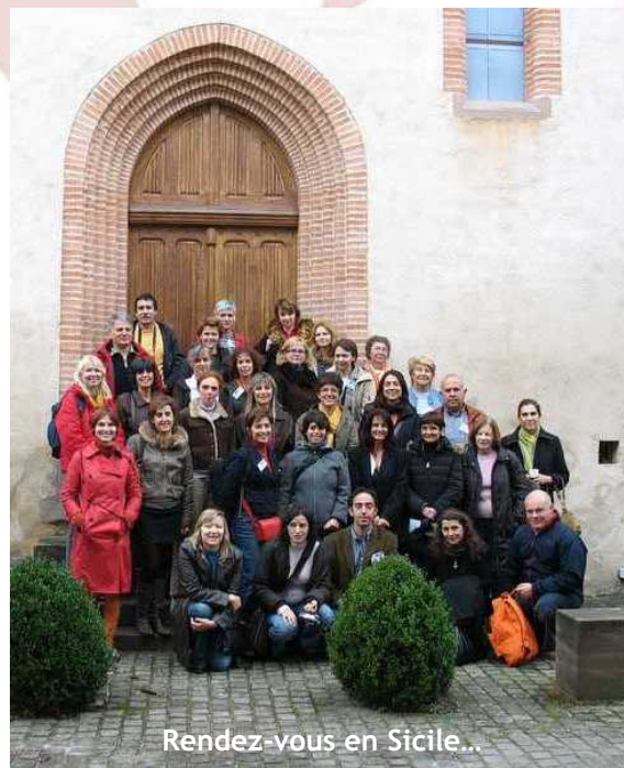
Rendez-vous en Sicile...

La visite de Trifyl à Blaye Les Mines les a passionnés. Les Lituaniens ont été particulièrement intéressés par les réseaux d'écoles en milieu rural et l'échange s'est terminé autour d'un repas terroir à Mirandol animé en chansons par les Portugais.